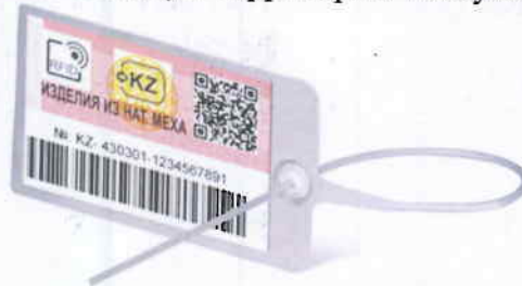
Рис 3. Пример изображения контрольного (идентификационного) знака для навесного (накладного) способа крепления на товар

[Handwritten signatures and marks at the bottom of the page]